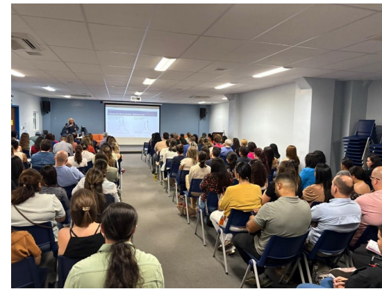
Capacitação em Arboviroses