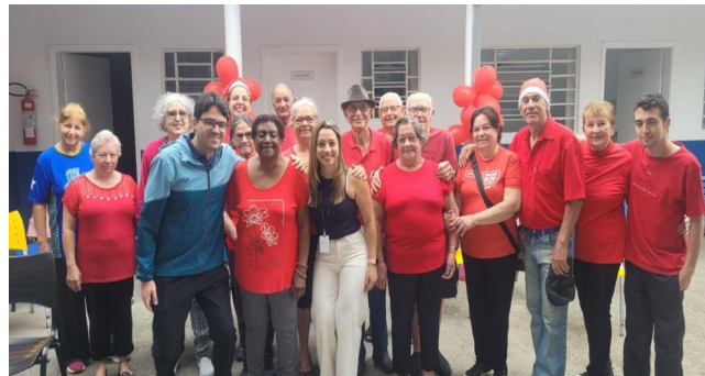
Confraternização do Grupo de Ginástica