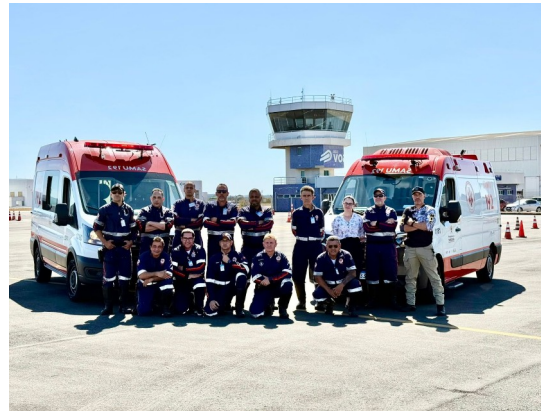
Treinamento de direção defensiva