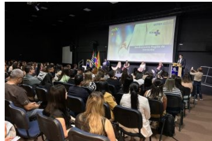
Acolhimento do médicos Programa Mais Médicos