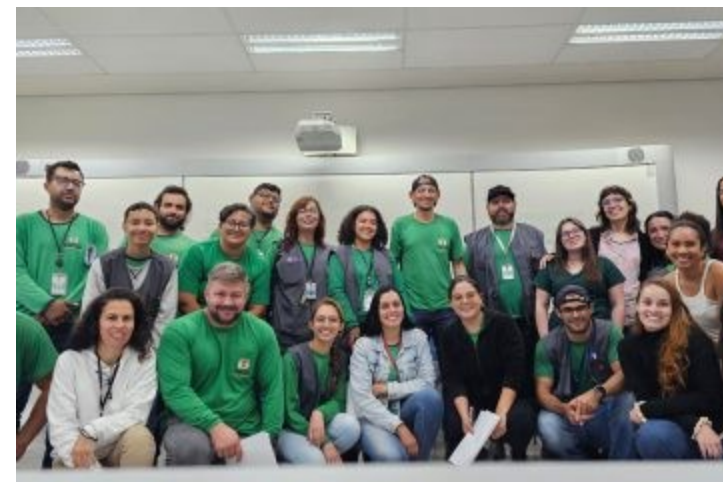
Oficina dos Residentes com os agentes de endemias