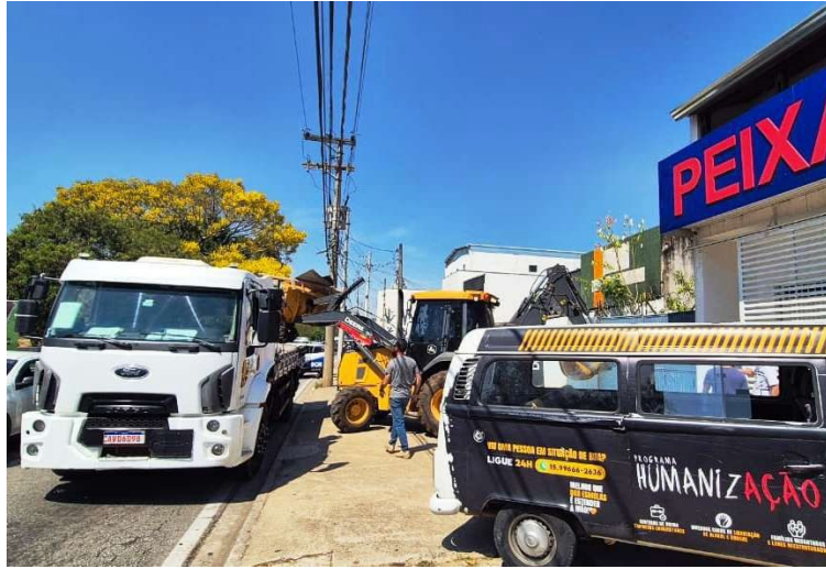
Ação de retirada de Inservíveis