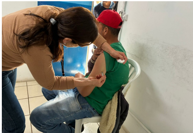
Ação de saúde no SOS