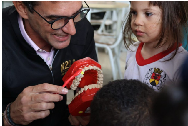
Projeto Escovação Nota 10