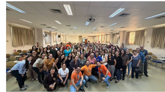
Capacitação Eclâmpsia e Pré- Eclâmpsia