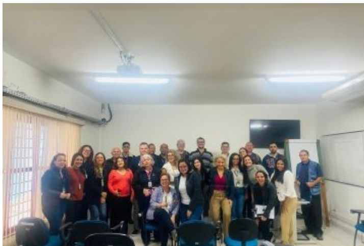
Ações Educativas CEREST