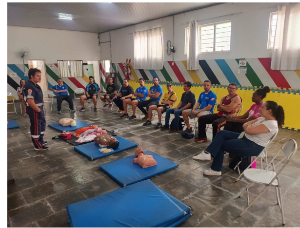
Treinamento de Primeiros Socorros