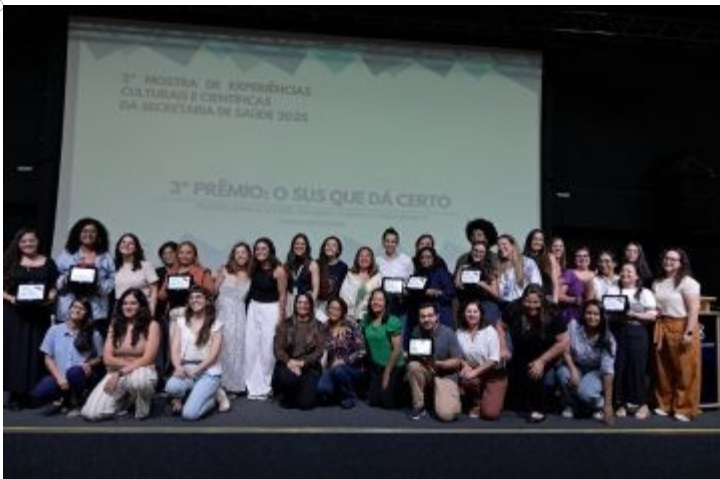
2ª Mostra de Experiências Culturais e Científicas