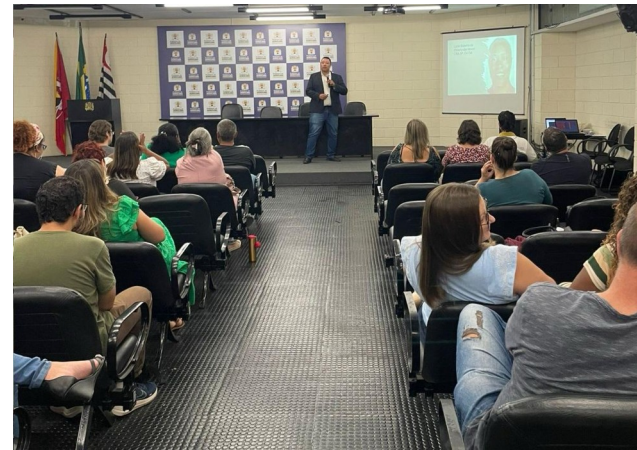
Seminário da População negra