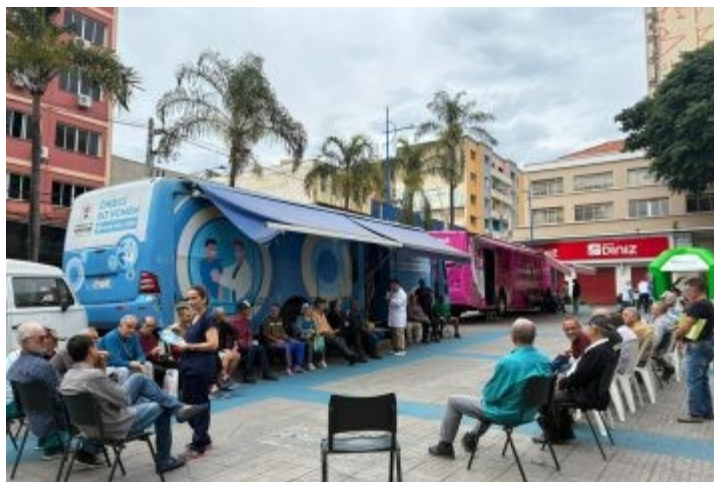
Ação de Saúde na Praça