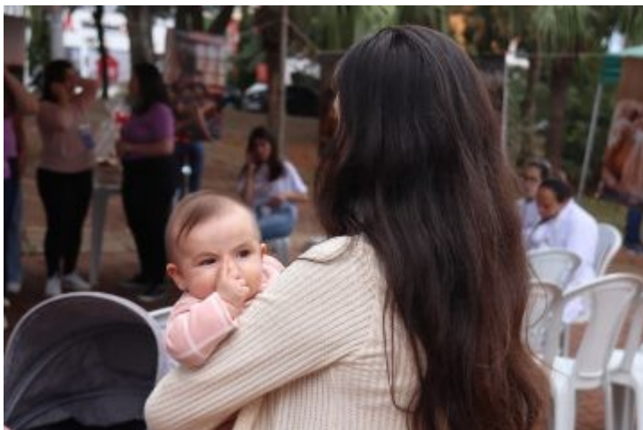
12º Seminário de Aleitamento Materno