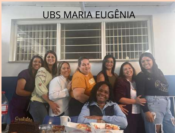
UBS MARIA EUGÊNIA