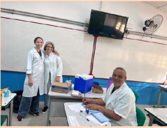
UBS NOVA SOROCABA