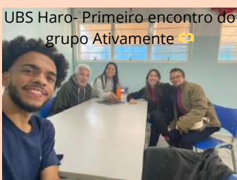
UBS Haro- Primeiro encontro do grupo Ativamente

Ação "Amigas do Peito" Referente ao dia Mundial da HAS realizada pelas ACS da USF Cajuru