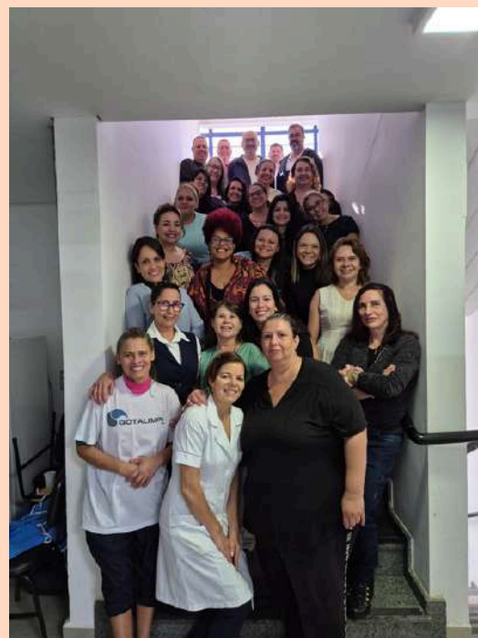
SAD- SERVIÇO ATENÇÃO DE DOMICILIAR