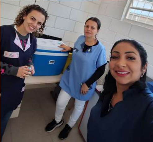
USF Lopes - Vacinação UM sucesso: Todas as crianças com vacinas atrasadas, atualizadas!