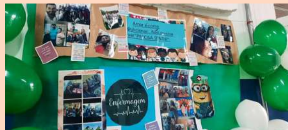
USF Vitória Régia