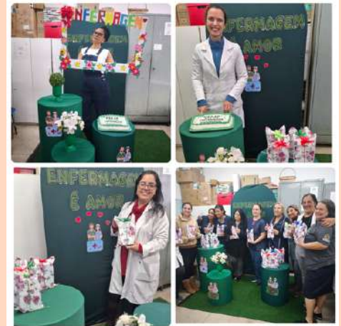
UBS Santana ♥