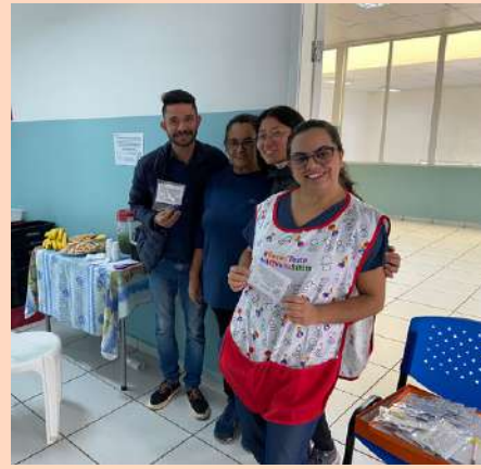
UBS São Bento