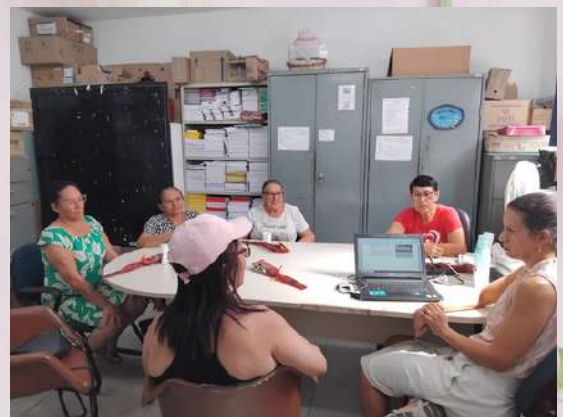
USF LOPES DE OLIVEIRA: Roda de conversa: Homenagem às mulheres