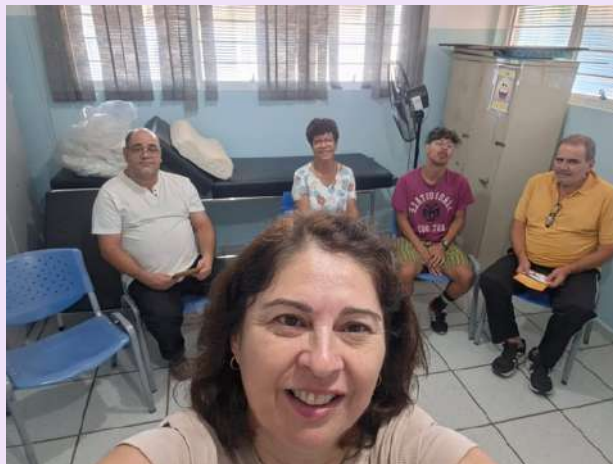
UBS Haro -Grupo do Tabaco