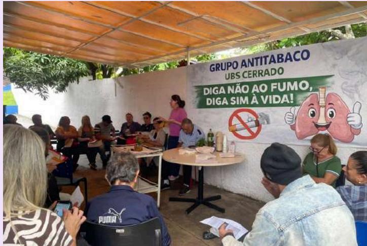
UBS CERRADO início da terceira edição do grupo antitabaco com 25 participantes