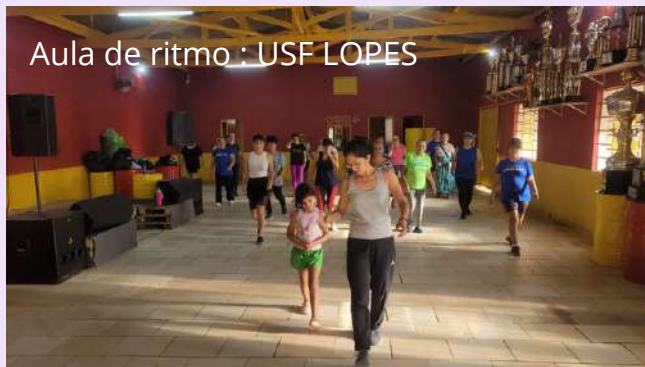
Aula de ritmo : USF LOPES

A atuação colaborativa e interdisciplinar reforça a atividade física como uma importante ferramenta de promoção da saúde, fortalecendo vínculos e ampliando o cuidado na Atenção Primária.