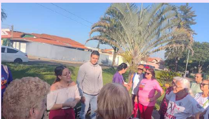
Roda de conversa sobre alimentação saudável (professora Nutricionista com estagiário) com o grupo de atividade física.