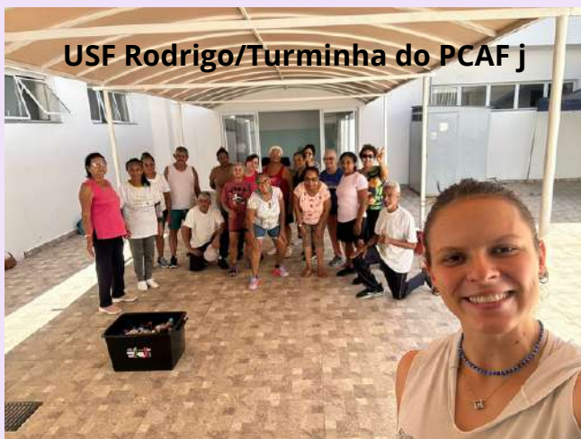
USF Rodrigo/Turminha do PCAF j