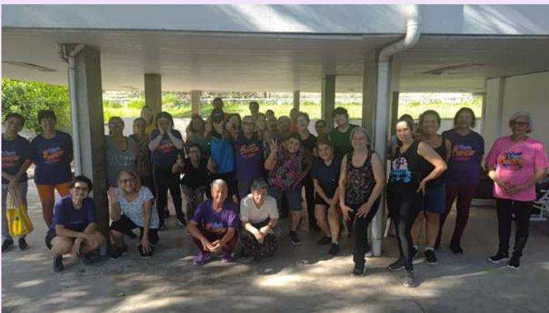
Grupo de pilates e ginástica UBS SOROCABA 1