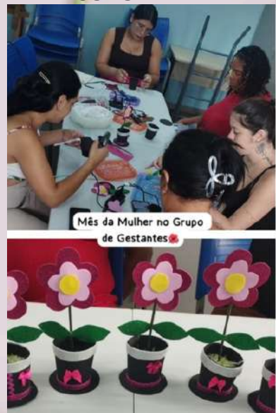
Mês da Mulher no Grupo de Gestantes