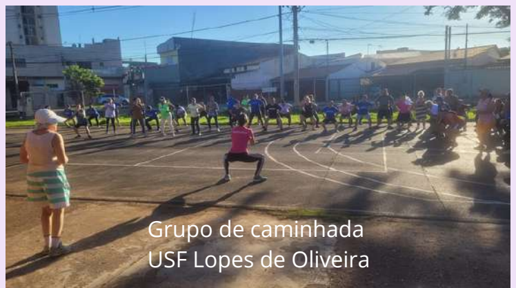
Grupo de caminhada USF Lopes de Oliveira