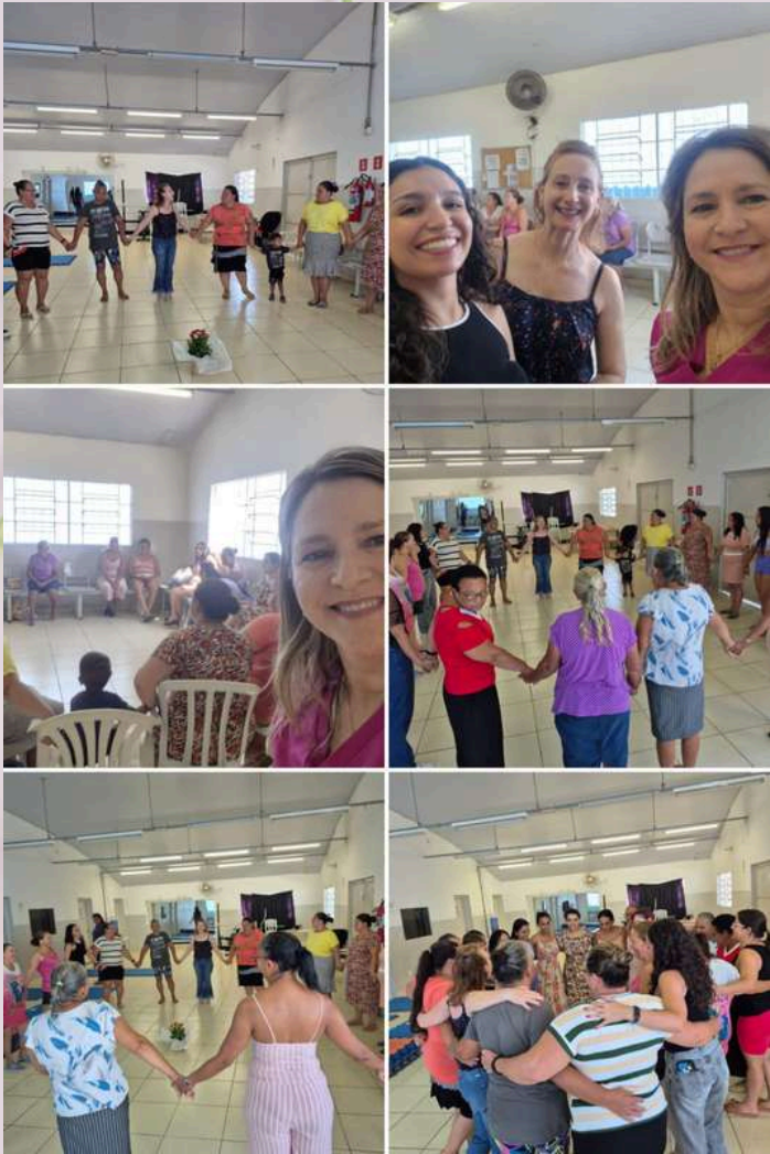
Ação CRAS/ESF Habiteto -Em comemoração, Mês -das-mulheres