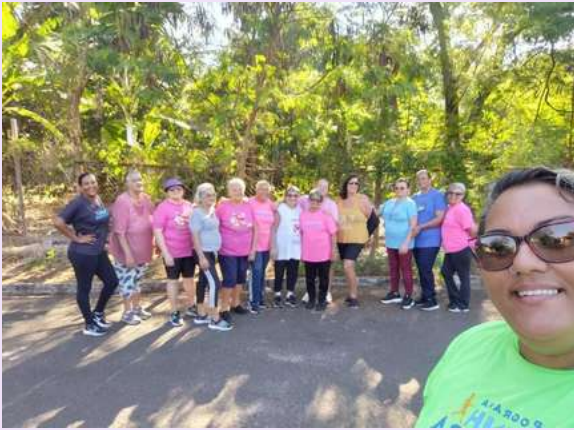
Grupo caminhada Ulysses