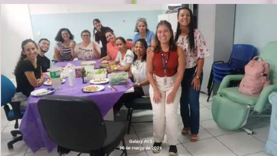
USF CAJURU: ALMOÇO ESPECIAL DO Dia das Mulheres

Wendell Aquino Wendell Aquino Wendell Aquino Wendell Aquino Wendell Aquino Wendell Aquino Wendell Aquino Wendell Aquino Wendell Aquino Wendell Aquino