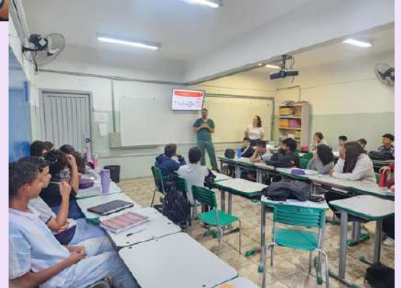
USF Aparecidinha: Ação na escola mencacci Sobre gravidez na adolescência e IST's.