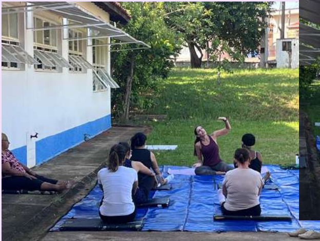
UBS NOVA SOROCABA- grupo de Yoga ganhando forma e novas integrantes!