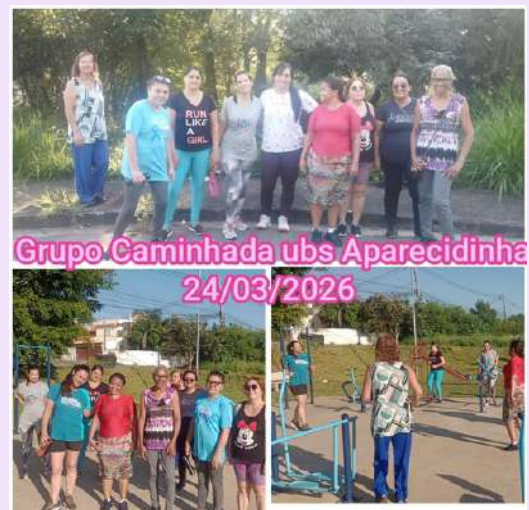
Grupo Caminhada ubs Aparecidinha 24/03/2026