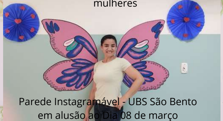
Parede Instagramável - UBS São Bento em alusão ao Dia 08 de março