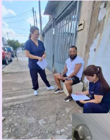
Busca ativa de TB território Ulysses . Parceria com os estagiários da UNIP