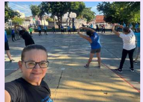
USF ULISSES DE GUIMARAES