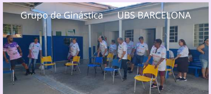
Grupo de Ginástica UBS BARCELONA