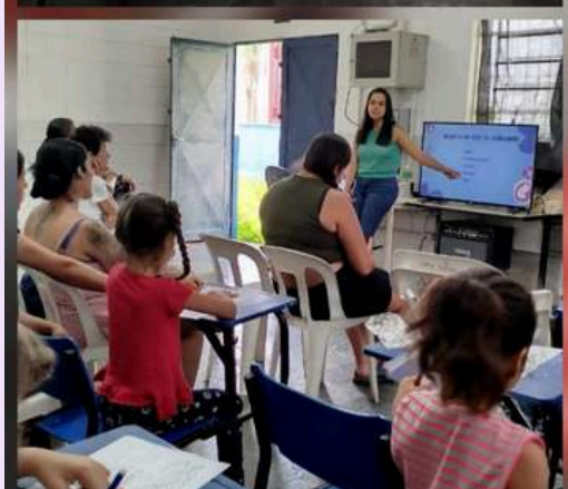
Ação na Escola do Carandá sobre Gravidez na Adolescência e Prevenção de IST's.